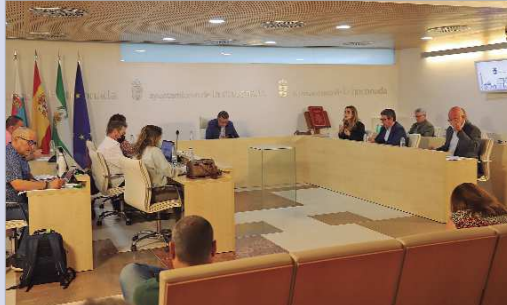
Imagen del Pleno Municipal en el que se aprobaron las ordenanzas.