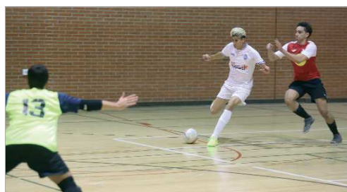
Imagen del derbi entre el San José FS y el Cañamera Futsal.

La Tercera Andaluza de Fútbol Sala, en su Subgrupo 1, cuenta con tres equipos de La Rinconada, pero los tres están en la parte media baja de la tabla. En la última jornada, los tres cosecharon sendas derrotas y