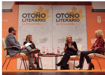
La periodista y escritora, Marta Robles, en La Villa.