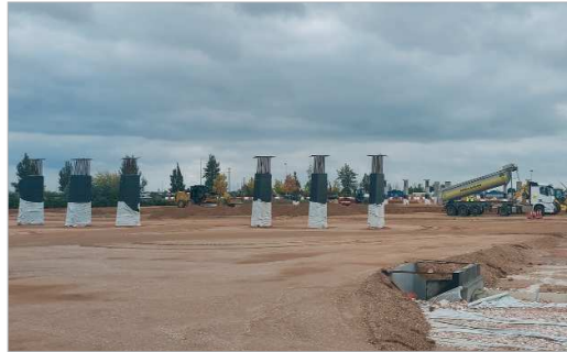
Los pilotes sobre los que se colocará el tablero ultiman su colocación.

Las obras para la ejecución del Viaducto que atravesará en altura La Unión a través de Pago de Enmedio en La Rinconada siguen avanzando según los plazos previstos. Según se desprende de las informaciones de la Consejería de Fomento Infraestructuras y Ordenación del Territorio de la Junta de Andalucía, en la actualidad, el capítulo de explanaciones está muy avanzado. Se han ejecutado satisfactoriamente todos los tratamientos de mejora de la