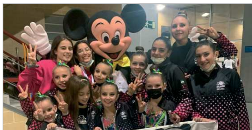
Representantes del Club Oso Panda en el Campeonato de Andalucía.

El Club Oso Panda Rinconadase corona en Córdoba en los diferentes circuitos del torneo Regional