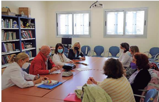
El Centro de Salud El Mirador acogió la reunión para retomar el programa.

El área de Salud desarrolla este taller para madres y padres de pequeños de 0 a 3 años de la mano de la Unidad de Gestión Clínica de La Rinconada y de las guarderías