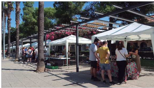
El parque Valle-Inclán volvió a acoger el mercado de cercanía 'Toma Tomate'.