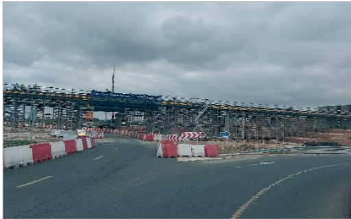
Las obras del Viaducto que cruzará en altura La Unión, siguen su curso.