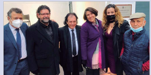
Los representantes del Proyecto Flamenco del Carmen Laffón.

El Proyecto Flamenco del instituto Carmen Laffón llega a su séptima edición en la que ha formado a alrededor de 200 jóvenes en este arte Patrimonio Inmaterial de la Humanidad. Un proyecto que cuenta con el auspicio del Ayuntamiento de La Rinconada y de la Fundación Cristina Heeren, en el que el Consistorio es mecenas público. El alumnado recibe