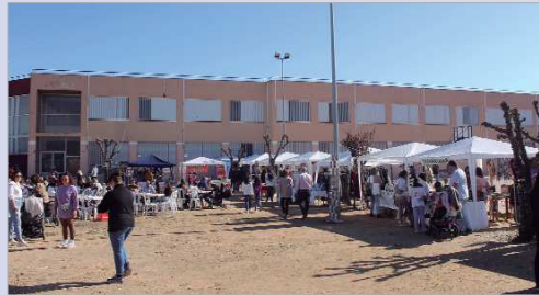
Diferentes stands en el evento 'Caca de la Vaca Festival'.

La Agrupación Parroquial Humildad y Caridad - El Olivo, en colaboración con el área de Comercio, celebró la segunda edición del festival que permitió un día de convivencia en el exterior del I.E.S. Carmen Laffón