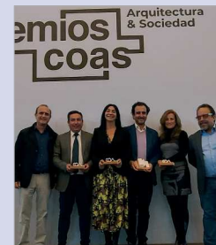
Foto de familia del premio.