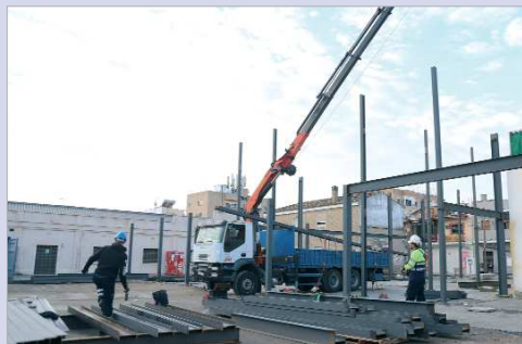
Las obras del nuevo Mercado de Abastos tienen una ejecución de 12 meses.

La nueva Plaza de Abastos se sitúa en el pasaje que conecta la nueva bolsa de aparcamientos de calle Virgen de las Flores, con la calle Virgen de Gracia, totalmente peatonal. El nuevo edificio tendrá unos 500 metros cuadrados, lo que posibilitará la instalación de unos ocho puestos, más servicio de bar y zonas comunes, entre las que destacan aseos, servicio de almacenaje y cuarto de residuos. Igualmente, se van a ejecutar unas amplias zonas comunes, que servirán de pasarela para acceder, a través del mercado, desde el aparcamiento a la zona comercial de Virgen de Gracia, lo que reducirá el