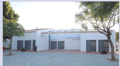
La Casa del Flamenco se ubica en Carretera Bética.