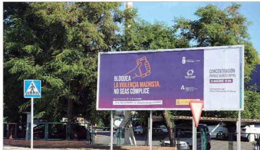
Imagen promocional de la campaña, en una valla publicitaria de La Rinconada.

"Estas cifras terribles nos hacen seguir luchando y tener un compromiso firme con la erradicación de cualquier tipo de violencia machista y combatir cualquier discurso negacionista y posicionamiento político que niegue la violencia de género o rechace políticas públicas enfocadas a