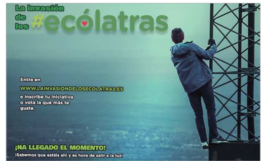
Cartel promocional de la nueva campaña de concienciación medioambiental.

Asimismo, también se reconocerá a la ciudad más ecólatra, premiándose al municipio con la mayor comunidad e iniciativas presentadas de toda la provincia, con una dotación de 1.000 euros que se destinarán a una organización benéfica de la localidad o para la compra de material deportivo o formativo de carácter medioambiental. Adicionalmente, todos los usuarios que se registren en la plataforma y voten iniciativas registradas accederán a un sorteo de un miniglú y premio en metálico.