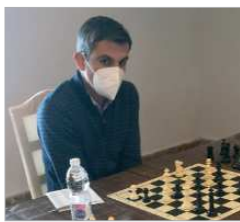
Imagen de uno de los duelos.

La fase regular de División de Honor, la máxima categoría del Ajedrez andaluz, finalizaba con la disputa de las tres últimas jornadas el mismo fin de semana, en la sede del Bahía Sur, en San Fernando. El conjunto rinconero saldaba sus compromisos con un empate ante el Oromana Cen Solutions y una victoria, la primera y única en esta fase