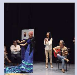
Inicio curso en el IES C. Laffon.