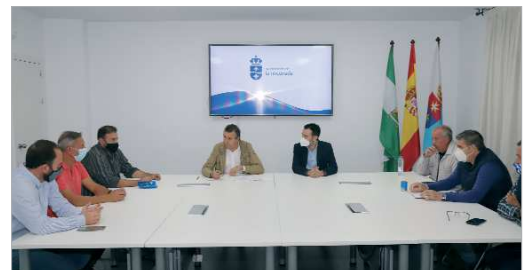
Momento de la reunión entre Patronato y clubes, para la firma de Convenios.

El Patronato de Deportes ha firmado recientemente los convenios de colaboración anuales con la Agrupación Deportiva San José y la Unión Deportiva Rinconada, para seguir fomentando la práctica deportiva en edades tempranas y los valores que emanan del deporte. Por parte del Consistorio, estu-