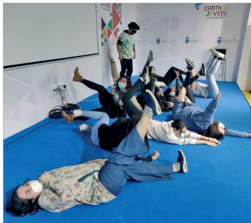
Desarrollo de una actividad de improvisación, dentro de la Red CreaJoven.

Salón de Videojuegos, Concurso de Graffiti, Artbigú mercado arte joven, exhibiciones y conciertos, Batalla de Gallos y el Concurso de Pop Rock. También se están desarrollando talleres de ilustración, iniciación a los videojuegos, teatro de improvisación musical y en diciembre comienza el de cultura urbana