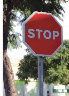
Se sustituirán más de 600 señales.

Así, a finales de este verano se iniciaba la primera fase de este plan, consistente en la renovación de los pasos de peatones del municipio y la señalización horizontal, que también incluye la división de los carriles. En total, la inversión rondaba los 45.000 euros, se trabajó en un centenar de calles y supuso el repintado de 30.000 metros cuadrados de señalización hori-