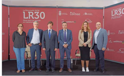
También estuvieron en el acto el alcalde y el presidente de Rinconada Global.