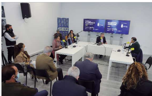
'Hoy por Hoy', de la Cadena SER, se emitió desde la Casa del Flamenco.

El Ayuntamiento de La Rinconada siembra flamenco y recoge sus frutos, todo ello a través de la colaboración pública, siendo mecenas de este arte universal, Patrimonio Inmaterial de la Humanidad. Y esa apuesta se ha materializado con la puesta en marcha de la Casa del Flamenco nominada 'Antonio Carrión' en reconocimiento al guitarrista local.