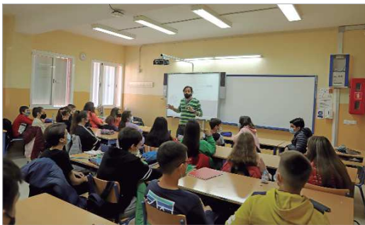
Una de las charlas impartidas en el IES Antonio de Ulloa.

Este primer trimestre se han impartido diferentes talleres de Afectividad y Crecimiento, Promoción de la Igualdad, Gestión de Emociones, LGTBI y Afectividad Sexual