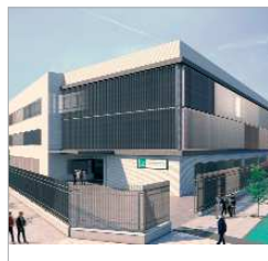
Imagen virtual del nuevo centro.

La empresa 'Tablero' será la encargada de ejecutar las actuaciones cuyo presupuesto se eleva casi a los diez millones de euros y su plazo de ejecución es de 18 meses. Está cofinanciado con fondos europeos