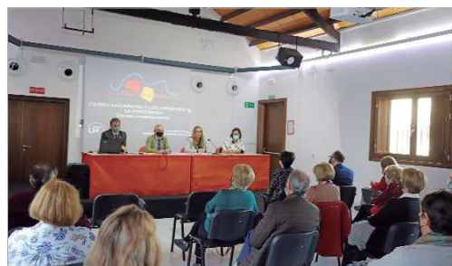
Jornada inaugural del nuevo curso del Aula de la Experiencia.