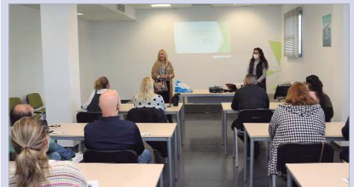
La delegada de Salud, Garzón, junto a los hosteleros de la localidad.

El objetivo es que amplíen sus conocimientos y aprendan una correcta manipulación, sin riesgo de contaminación cruzada, que garantice la seguridad de los comensales