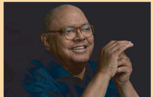
Pablo Milanés pondrá el broche de oro a la programación de 2021.

Las entradas pueden adquirirse a través de la web entradas.larinconada.es o bien en taquilla desde una hora antes de la función o en La Villa, de lunes a viernes, de 10.00 a 12.00 horas.