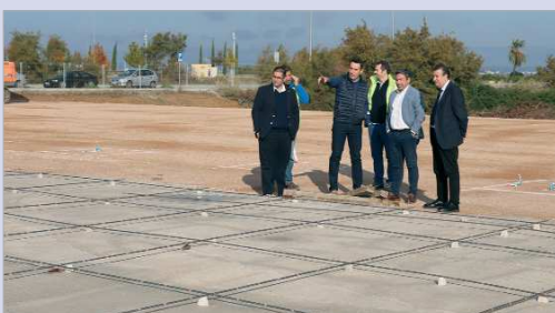
Fernández conoció el avance de las obras del nuevo Pabellón Deportivo.

La Rinconada contará con un tercer pabellón deportivo cubierto, que se sumará al Fernando Martín y al Agustín Andrade antes de que finalice el año 2022. Las obras ya han comenzado y suponen una nueva dotación pública en los suelos de La Unión. Esta nueva infraestructura viene a mejorar la calidad de vida de la población, potenciar el deporte de proximidad, a través de Escuelas de Iniciación, Mantenimiento de Adultos y deporte como fuente de salud, respaldar al deporte federado mediante la cesión de espacios que mejoren la respuesta a sus necesidades