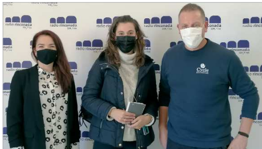
Representantes de AR San José visitaron los estudios de Radio Rinconada.

En el marco del 15 de noviembre, Día Mundial Sin Alcohol, Radio Rinconada recibía a las entidades locales que, desde el ámbito asociativo y los servicios municipales, desarrollan tareas de asistencia y prevención en esta materia. De esta manera, por los estudios de la emisora municipal pasaron por un lado la secretaria de la Asociación Alcohólicos Rehabilitados San José,