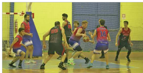
Imagen del duelo entre el Wifiguay La Vega y el PG Alcalá.

El Wifiguay Club Baloncesto La Vega de La Rinconada suma dos victorias y dos derrotas en los cuatro partidos de la Liga Regular que lleva disputados en Primera Provincial, categoría a la que ascen-