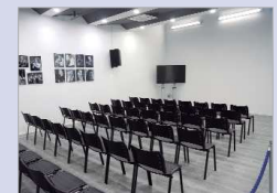
Sala de auditorio interior.