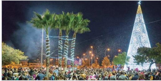
El próximo 3 de diciembre, La Rinconada vivirá a iluminarse de Navidad.

El próximo 3 de diciembre, desde el Bulevar Almonazar, se procederá al encendido del alumbrado, punto de partida de las fiestas